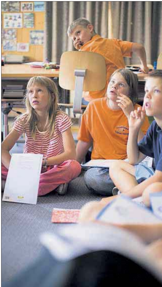
Bündner Schüler sind noch wenig von Lehrermangel tangiert: Schule in Davos Monstein.