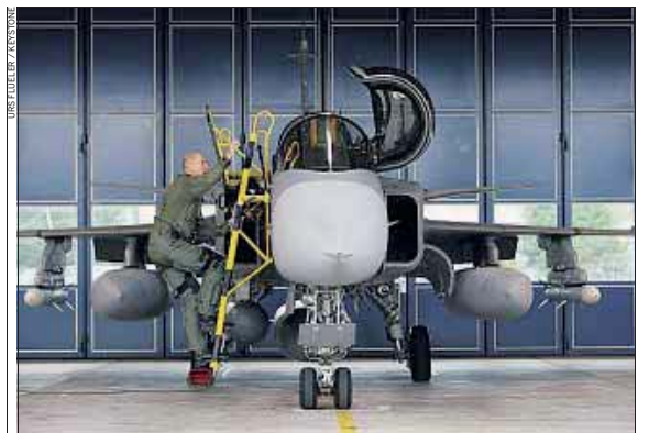
Der schwedische Gripen ist einer von drei zur Auswahl stehenden neuen Kampffjet-Typen.