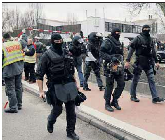
Ein Schüler tötete bei einem Amoklauf in Winnenden (D) 15 Menschen. (11. März 2009)

Entwickelt hat die Software die Technische Universität Darmstadt, nachdem Amokläufe mit mehreren Opfern an deutschen und amerikanischen Schulen für Entsetzen gesorgt hatten. Zur Erarbeitung des Computerprogramms wurden Ermittlungsakten über Amokläufe ausgewertet und spezifische Indikatoren ermittelt. Frankfurt hat bereits erste Erfahrungen mit der Software gemacht. Zürich sei aber die erste Grossestadt, die das Programm allen Volksschulen zugänglich machen wolle, sagt Zurkirchen.